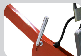
Poignées réglables en hauteur